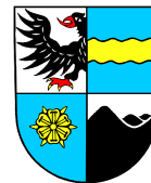
Freudenberg am Main